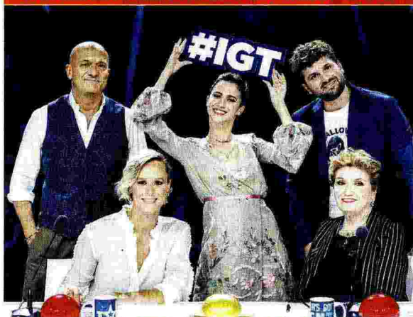
Claudio Bisio è uno dei quattro giudici di Italia's Got Talent che questa sera su TV8 vedrà il vincitore del 2019 con la finalissima. Il suo Golden Buzzer è andato a all'Academy Musical Gypsy di Torino