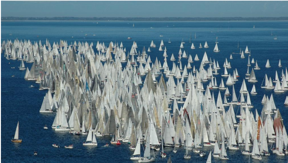
La Barcolana di Trieste

Ecco le terzine finaliste nei saggi e nella narrativa e i vincitori delle sezioni giornalistiche. Celebrata la Barcolana di Trieste e ricordato un giurato che non c'è più